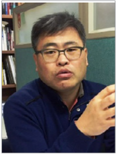
박현준 경기비정규직 지원센터

경기도 연정 합의로 노동국(일자리노동정책관) 신설을 앞두고 있다. 그러나 그동안 이러한 노동 정책이 도민의 의사를 올바르게 반영했을까? 이전에 제정된 수 많은 노동정책이 사문화 되고 시행이 유명무실하게 되었던 전철을 밟지 않을까? 지방정부의 한계와 네트워크의 부족 등 여러가지 조건의 어려움을 생각하니 걱정이 앞선다.